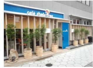
JR 玉造駅近くのカフェシャドーツリー