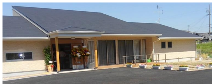
H29.6.1 交野市にオープン バリアフリーグループホーム》

④障害児通所支援事業所(寝屋川教室、北摂教室、泉北教室、河内長野教室、岸和田教室)