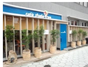
JR 玉造駅近くのカフェシャドツリー