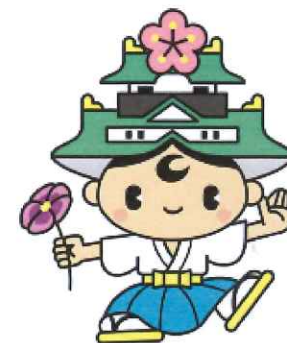
中央区マスコットキャラクター ゆめまるくん